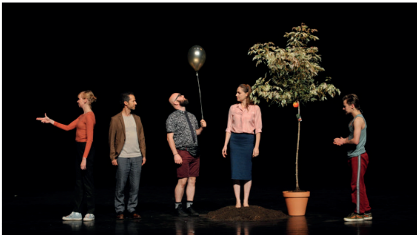
Ontroerend Goeds originalproduktion av Are we not drawn onward to new erA.